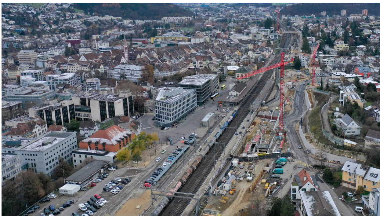
Der Stand der Arbeiten am 3. Dezember 2020.

Weitere Visualisierungen, Baustellenfotos und Videos finden Sie unter www.sbb.ch/liestal . → Bilder und Visualisierungen.