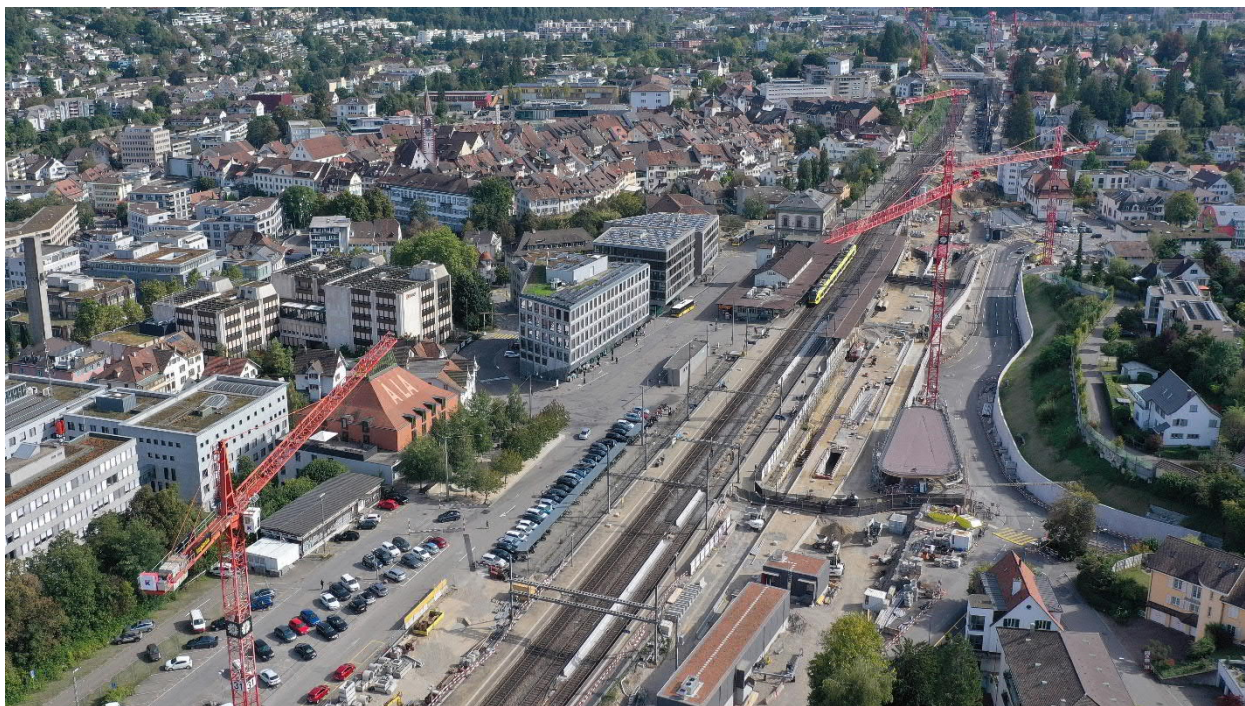
Der Stand der Arbeiten am 2. Oktober 2021.

sowie das neue Bahnhofgebäude. Diese sind Teil des Projekts Bahnhofareal Liestal von SBB Immobilien. Weitere Visualisierungen und Baustellenfotos finden Sie auf www.sbb.ch/liestal .