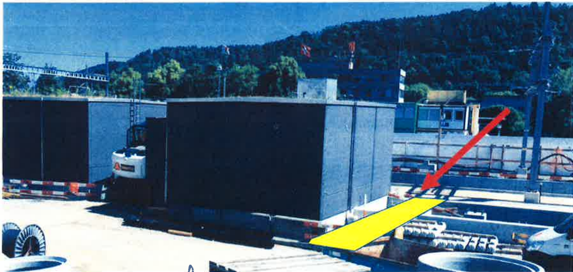
Abbildung 1; Neues BLT-Stellwerk mit möglichem Zugang zu den Perrons 4 + 5 in gelber Farbe

So eine direkte und barrierefreie Direktverbindung würde sicher auch eine starke Entlastung für die Pendlerströme der SchülerInnen mit sich bringen und das Ziel unterstützen, die FussgängerInnen in Richtung Sichernquartier via die Begegnungszone Sichern zu bewegen.