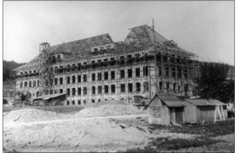
Das Rotackerschulhaus.

Das und vieles Andere mehr erfahren Sie in der neuen Heimatkunde, wie z.B. Junge Künstlerinnen und Künstler, die Liestal hervorbrachte und die heute in aller Welt tätig sind. – Wo wächst der Hühnerdarm und was ist Baselgät? – Carl Spitteler als theologischer Struwwelpeter. – Liestaler Originale des 20. Jahrhunderts – Wo leben Liestals Schlangen? – Wieso hat Liestal eine oxsenblutrote Schwarzwaldkirche? – Die Musical-Night und Viva Cello. – Was waren Gerichtssässen und Ungenossame – samt Wunn und Weid? – Welche Töne und Inschriften weisen die Glocken der Stadt-