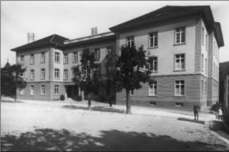
Das ehemalige Orisschulhaus.

Nachdem es an den bisherigen Standorten zu eng geworden war, wurde 1854 für die städtische Alltagsschule das Orisschulhaus auf dem Hinterseehügel eröffnet. Es wurde gleichzeitig mit der Bahn- und Stationsanlage erbaut. Das Raumprogramm umfasste 6 Schulzimmer, 6 Lehrerwohnungen, 1 Gemeindesaal, 1 geräumige Remise für die Feuerspritze und «einige vorrätige Zimmer, die später noch verwertet werden könnten.» 1875 musste es bereits aufgestockt und erweitert werden. Für die Wahl des Platzes sprachen die «nicht zu entfernte gesunde Lage, freie, geräuschlose Umgebung, gefahrloser, freier, leichter Zugang und Wasser in der Nähe.» Bei der Einweihung wurde gesungen und gepredigt, «nachher wurden die Kinder mit kaltem Braten, 1/2 Schoppen Wein, einem Batzenbrot, zwei Spritzenküchli und drei Schenkeli abgespiesen und nach einer Ansprache entlassen.» Nach dem Bau des Rotackerschulhauses wurde das Orisschulhaus 1914 an den Kanton verkauft, der es zum Gerichtsgebäude umbaute, wohin 1921 auch die Kantonsbibliothek aus dem Regierungsgebäude umzog.