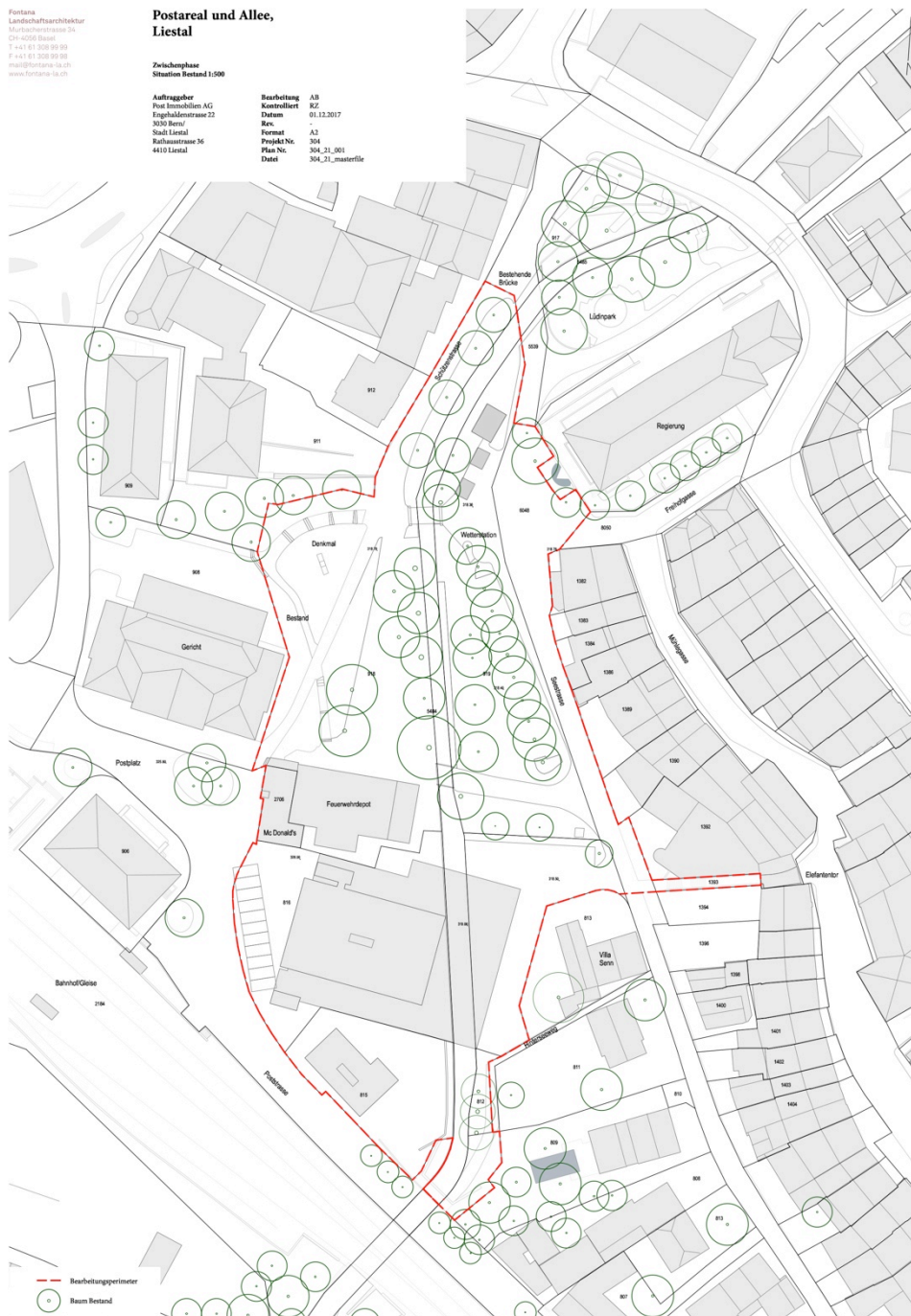
Abb. 1: Bearbeitungsperimeter

Die Naturwerte im Bearbeitungsperimeter Postareal und Allee sollen erhoben und kurz charakterisiert werden.