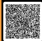
Liestal Abwasserkontrolle ext.

Sutter Ingenieur- und Planungsbüro AG Rufsteinweg 1 4410 Liestal Tel. 061 935 10 20 Andreas.Schenker@sutter-ag.ch https://www.sutter-ag.ch/